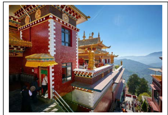
Kloster Namu Buddha