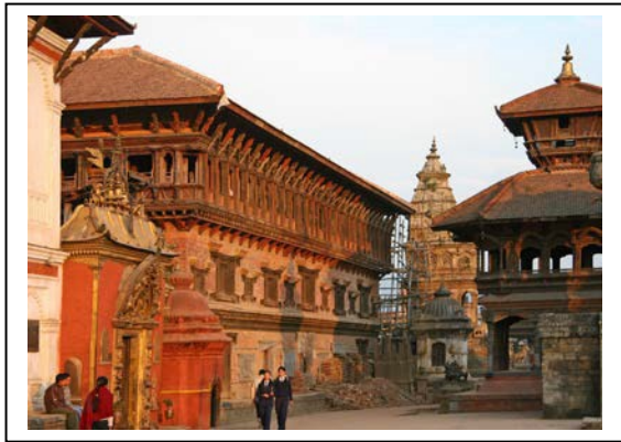
Altstadt von Bakthapur