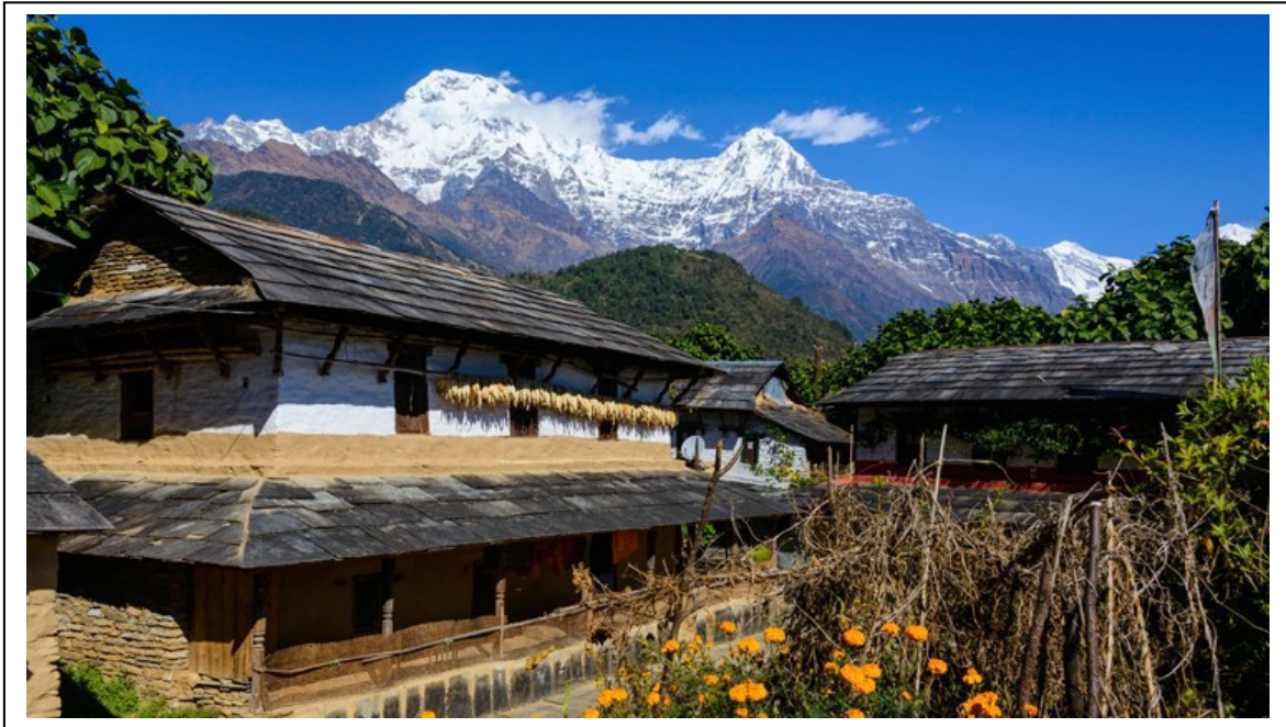
Ghandruk mit Annapurna

An allen Trekkingtagen gibt es nachmittags Gelegenheit inhaltlich zu arbeiten und auch eigene „Auszeit“ zu haben